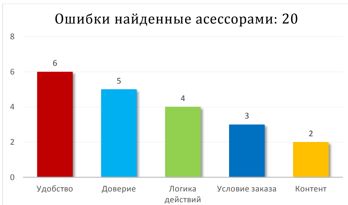
Таблица: Ошибки и замечания, найденные ассессорами на сайте