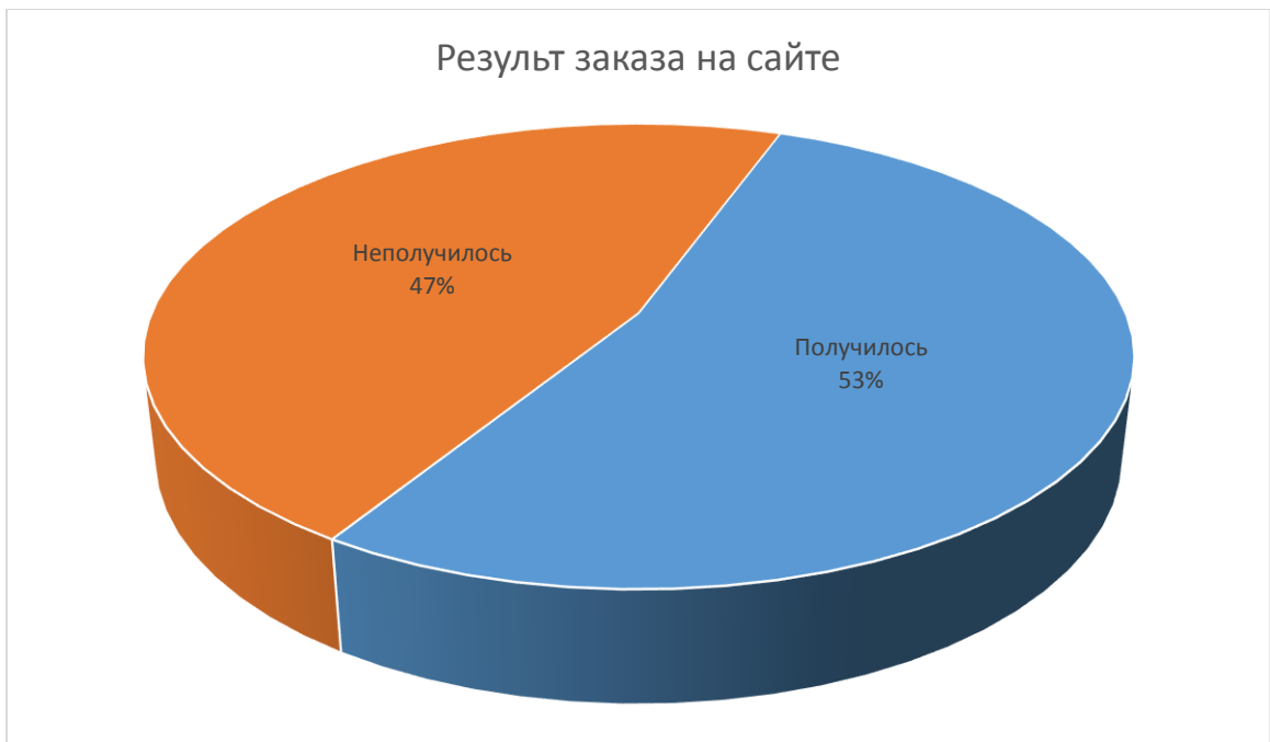
Таблица 2: Возможность совершить заказ на сайте.