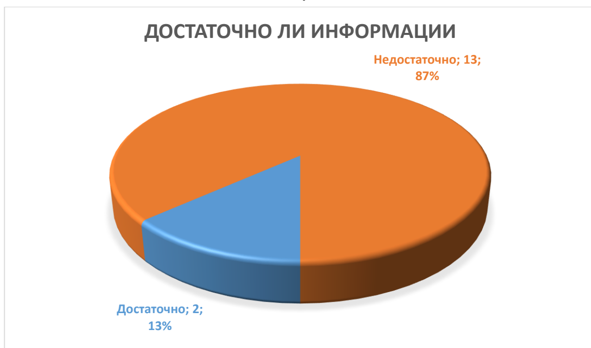
Таблица: Какой информации не достаточно на страницах товаров.

3. Посмотрите на сайте несколько интересных вам товаров. Какой информации для вас, как покупателя, не хватает на страницах этих товаров? Какая раскрыта не полностью? Что стоит добавить на эти страницы?